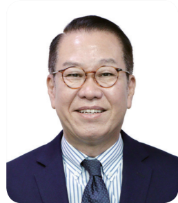
권영세 통일부 장관

통일부는 올해 「2022 한반도국제평화포럼」을 8월 30일부터 9월 1일까지 3일 간 개최합니다. 한반도국제평화포럼은 한반도 평화와 공동번영, 통일에 대한 국제사회의 지혜와 담론을 모아, 우리 정부의 대북정책, 통일정책에 반영하고자 2010년부터 통일부가 개최해 온 1.5트랙 다자 국제회의입니다.