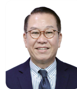
KWON Youngse Minister of Unification

This year, the Korea Global Forum for Peace hosted by the Ministry of Unification (MOU) will be held from August 30 to September 1, 2022. The Korea Global Forum for Peace (KGFP) is a Track 1.5 multilateral dialogue organized by the MOU since 2010 to garner wisdom and discourses of the international community on peace, co-prosperity, and unification of the Korean Peninsula and reflect those in the Republic of Korea's policy toward North Korea and unification.